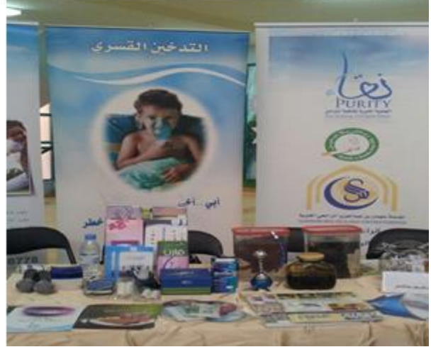
ثانيا :مسابقة (صورة وتعليق).